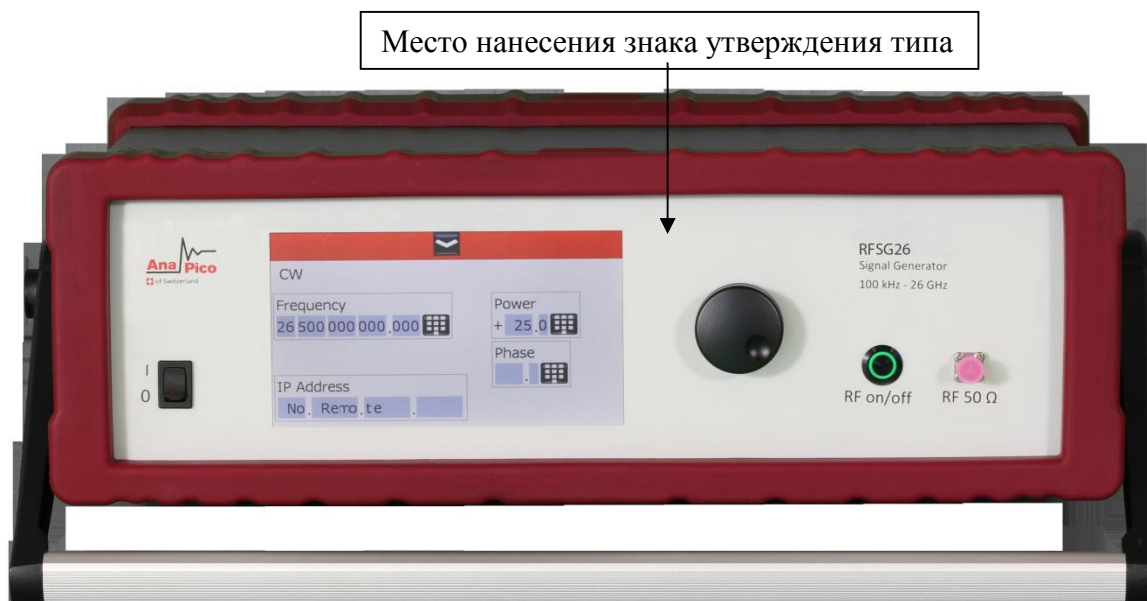
Рисунок 5 - Общий вид лицевой панели генераторов сигналов RFSG26 (RFSG12, RFSG20) с опциями RFSG12-TP, RFSG20-TP, RFSG26-TP