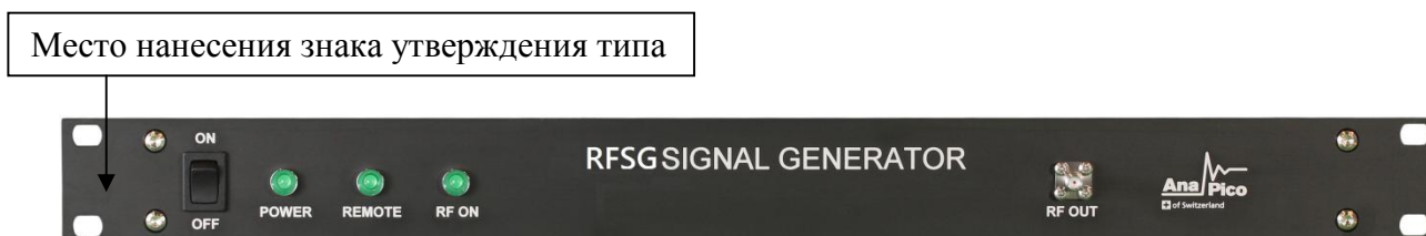
Рисунок 7 - Общий вид лицевой панели генераторов сигналов RFSG12, RFSG20, RFSG26 с опцией RFSG12-1URM, RFSG20-1URM, RFSG26-1URM соответственно