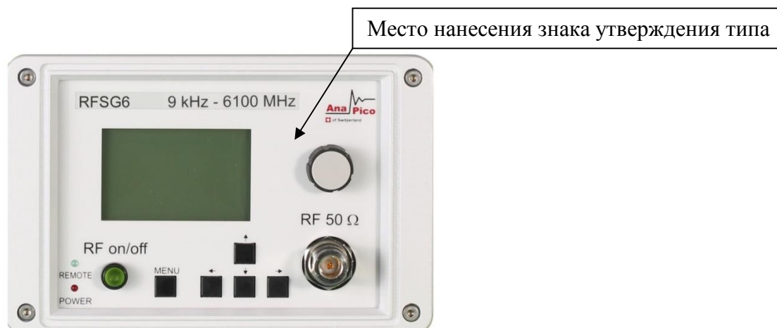
Рисунок 1 - Общий вид лицевой панели генераторов сигналов RFSG2, RFSG4, RFSG6

Общий вид генераторов с указанием мест нанесения знака поверки, знака утверждения типа и пломбирования приведён на рисунках 1 - 8.