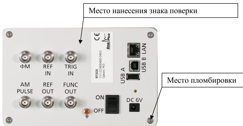
Рисунок 2 - Общий вид задней панели генераторов сигналов RFSG2, RFSG4, RFSG6