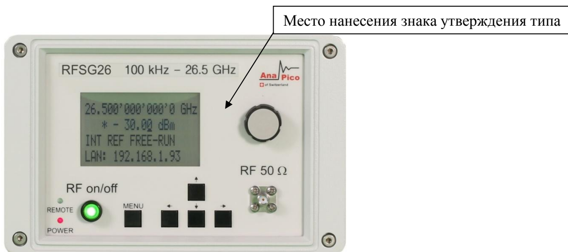
Рисунок 3 - Общий вид лицевой панели генераторов сигналов RFSG12, RFSG20, RFSG26