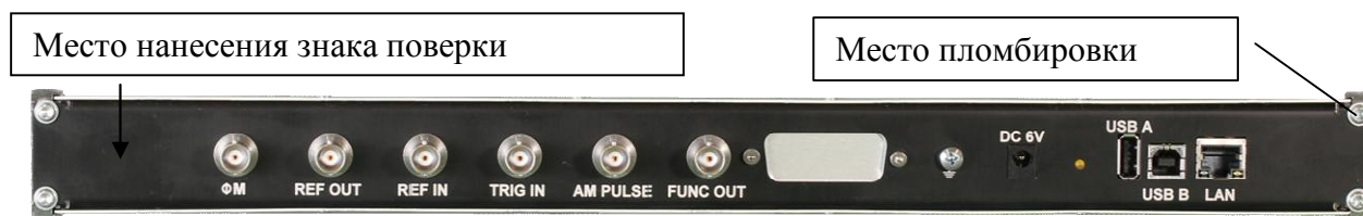
Рисунок 8 - Внешний вид задней панели генераторов сигналов RFSG12, RFSG20, RFSG26 с опцией RFSG12-1URM, RFSG20-1URM, RFSG26-1URM соответственно