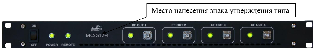
Рисунок 3 - Общий вид лицевой панели генератора (модель с четырьмя выходными каналами)