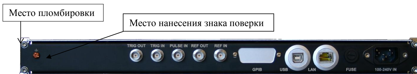
Рисунок 4 – Внешний вид задней панели генератора (модель с четырьмя выходными каналами)